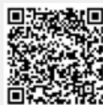
扫码观看万顺祝福视频