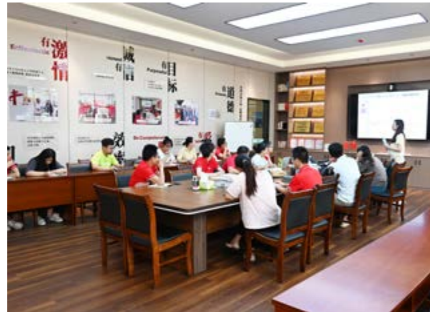
进行 OPEX 审核