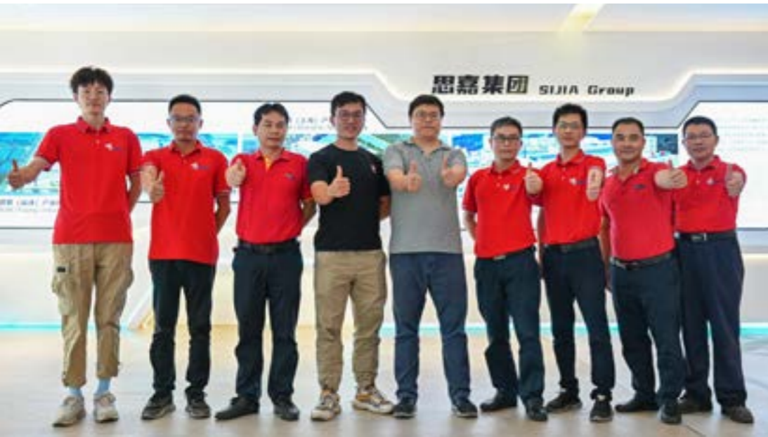
与 QA 复审审核员合影