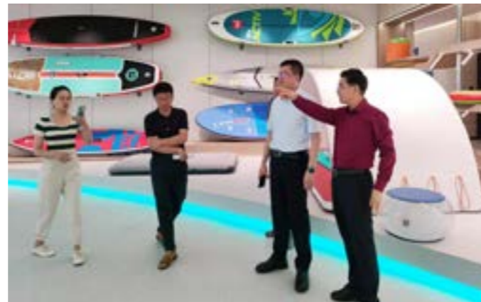
吕立邦副区长一行来访

座谈中，林董事长对公司近期发展情况做了介绍，特别是公司正在持续推进的数字化工厂建设项目和产学研项目情况。吕副区长对公司的技术创新与数字化、智能化生产转型提出指导性建议，并与林董事长进行更多数字化趋势、技术创新相关交流。