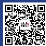
思嘉超能芯公众号