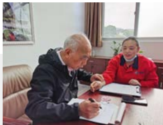
健康顾问上门看诊

为便利员工关注自身健康状况、随时进行健康咨询，公司从医疗卫生机构聘请健康顾问，每月定期到厂为员工看诊，提供健康咨询服务。