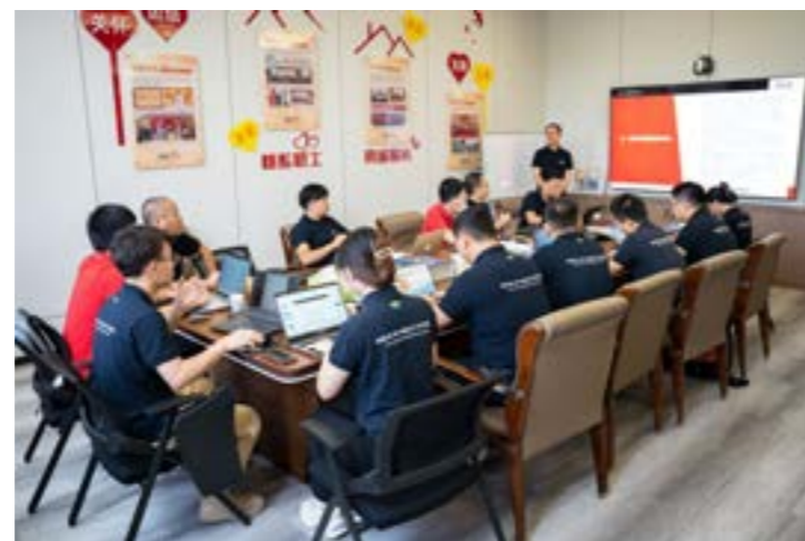
建材事业部年中总结与培训会议