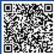
扫码观看恒力集团祝福视频 ▲

SIJIA Group, focusing on the production of multi-functional industrial polyester composite material, has been a benchmark enterprise in the industry. In recent years, we have witnessed the fast development of SIJIA Group, and we are very happy for you.