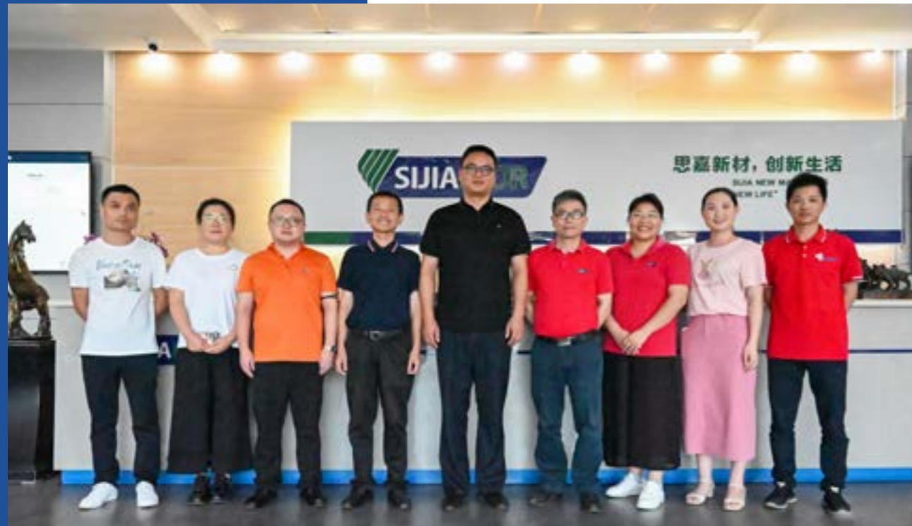
与恒力化纤团队开展供应链交流

思嘉集团专注生产多功能高强工业聚酯复合材料产业链产品，已经发展成为行业的标杆企业。这几年，我们看到了思嘉集团跨越式的发展，很为你们感到高兴。