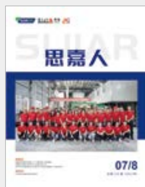
总第 010 期 (2022 年 7-8 月)