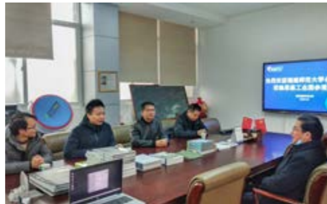
与福师大专家教授进行技术交流

值此思嘉集团成立二十周年之际，我谨代表福建师范大学，聚合物资源绿色循环利用教育部工程研究中心、福建省改性塑料技术开发基地、福建省环境友好高分子材料工程技术研究中心等产业创新平台，向思嘉集团表示热烈的祝贺和衷心的感谢。