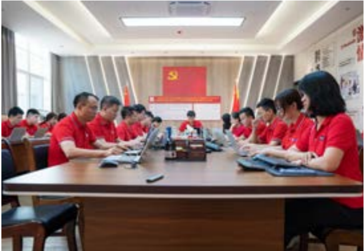
材料事业部年中总结与培训会议

7月11日至16日，思嘉集团2022年中工作总结大会在思嘉(福州)产业园召开，材料事业部与建材事业部分别就上半年生产、销售、品牌建设情况进行总结，并部署下半年工作。