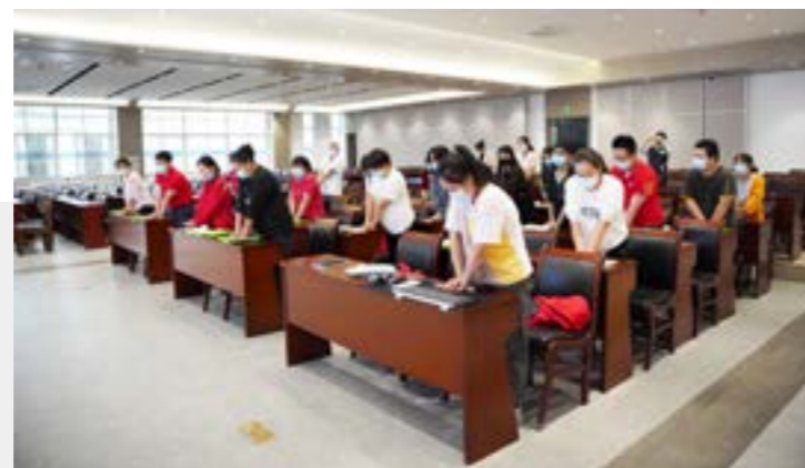
急救健康与职业病防治知识培训