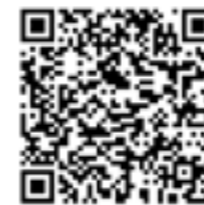
扫码观看海湾集团祝福视频 ▲

We are delighted to hear that SIJIA Group is approaching its 20th birthday! Since 2015, HAIWAN has witnessed the continuous development and growth of SIJIA.